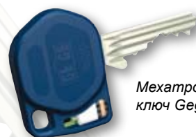
Мехатронный ключ Gege elologic

Мастер системы Gege предлагают множество вариаций и комбинаций а также они совместимы друг с другом. Более того, механический цилиндр Gege rExtra может быть интегрирован в мехатронные системы Gege elologic.