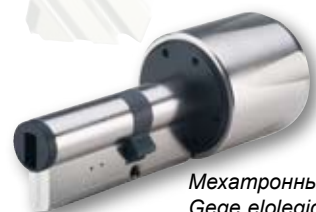
Мехатронный цилиндр Gege elologic